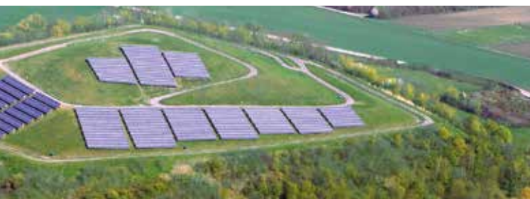
Flächenanlage Solarberg Speyer

Mit nur 2,00 Cent pro Kilowattstunde mehr können Sie Ihren kompletten Energiebezug bezuschussen. Helfen Sie mit, die Lebensqualität in unserer Stadt und in der Region nachhaltig zu verbessern.